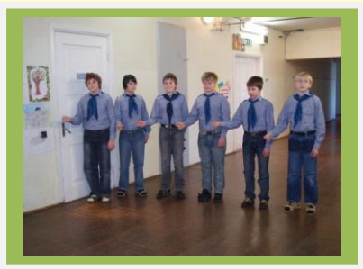
6.c klassi noorkotkad esinemas

Nagu heaks tavaks on saanud, toimub Võrumaal uute liikmete vastuvõtt noorteorganisatsiooni ridadesse vabariigi sünnipäeva paiku. 04. veebruaril toimus pidulik koondus Võrusoo rühmas. Meiega olid liitunud Haanja-Ruusmäe kooli noored. Pühaliku töötuse kodutütarde organisatsiooni astumiseks andis kaheksa neidu. Samas toimus ka noormeeste vastuvõtt. Seekord täienesid organisatsiooni read nelja