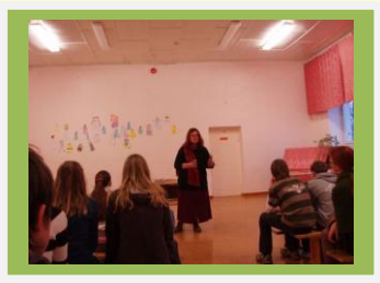
Aidi Vallik esinemas