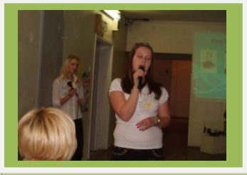
Julge esinemine tagab edu