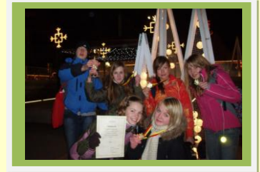
Pärast võidukat lõppvõistlust