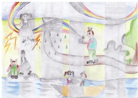
„Mere taga metsa taga“ Aliis Lang 6.a klass