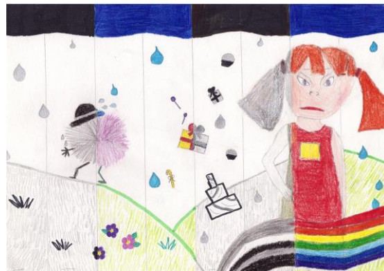
„Mere taga metsa taga“ Cassandra Piirioja 6.a klass