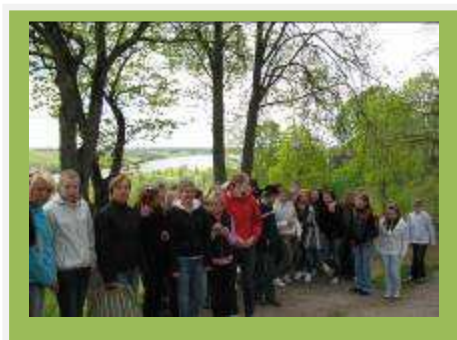
Viljandi järv on laulustki tuttav