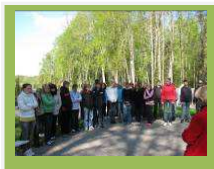
Giid räägib kuulsast väejuhust