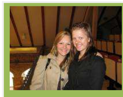
Täna ei pea tunnis pingutama!