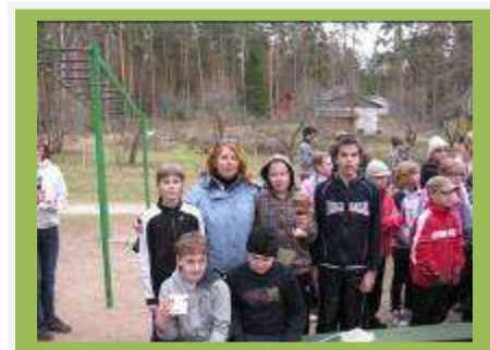
Võidukas 6.b klassijuhatajaga

1.aprill on naljapäev. Meie tulime sel päeval kooli nii, et välimuses pidi olema midagi teistmoodi kui tavaliselt, see tähendab siis, et pahupidi. Vahetundides kogunesid klassid üles saali, kus vaadati kõigepealt, kui paljud teistmoodi välja nägid ja siis täideti naljakaid ülesandeid ning tehti mängu.