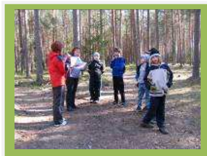
Küsimust tuli tähelepanelikult kuulata