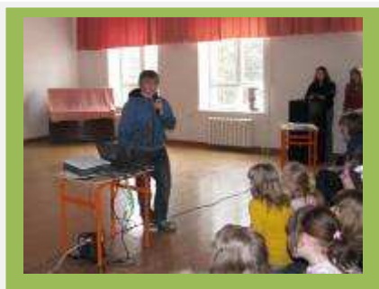
Jürijooksule eelnes tervisekonverents