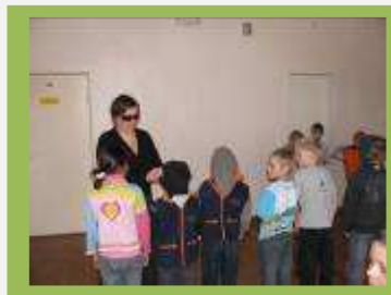
Silmad on kuklas