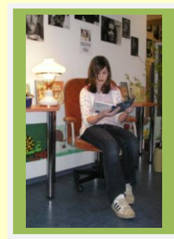
Esineda tuli kirjanike valvsa pilgu all