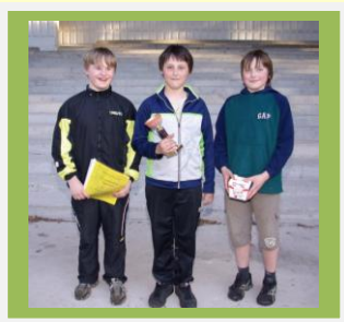
6.c võitjameeskond, tüdrukud olid pidistamise ajaks koju läinud