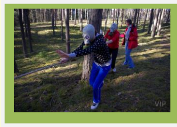
8.a leiab klassijuhataja toetusel õige suuna

Jürijooks on meie kooli traditsiooniline üritus, mis toimub igal aastal 23. aprillil. Alguse sai see 2000.aastal, seega tänavu oli jooks juba kaheksas. Üritus toimus Kubja metsas, koguneti laululava juures ning läbida tuli 6 kontrollpunkti, lahendades igas neist erinevaid ülesandeid. Erinevalt eelmistest jooksudest võeti tänavu aega ainult kontrollpunktides - kui palju kulus ülesannete lahendamiseks. Ehkki esialgu kuuldus õpilaste seast arvamusi, et nii on see üritus mõttetu, oldi lõpuks sellise asjakorraldusega väga rahul. Võistkondi osales sel aastal 29 (ligi 200 õpilast). Kõige rohkem oli osalejaid meie oma koolist, aga kaasa tegid ka Kreutzwaldi ja Kesklinna gümnaasiumite ning Krabi, Osula, Misso ja Vastseliina