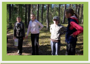
6.a on pisut nõutu: Kõik männid on nii ühtemoodi!