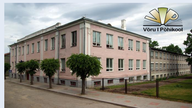
Võru I Põhikool Seminari 1 koolimajas 1930-2014

Võru I Põhikooli ajaleht – www.vip.edu.ee – mai 2014