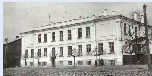
Vana kooli kiri teekaaslastele