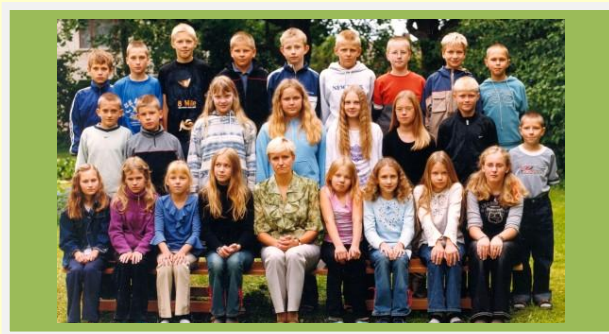
Klassipildid aastast 1999 ja 2003