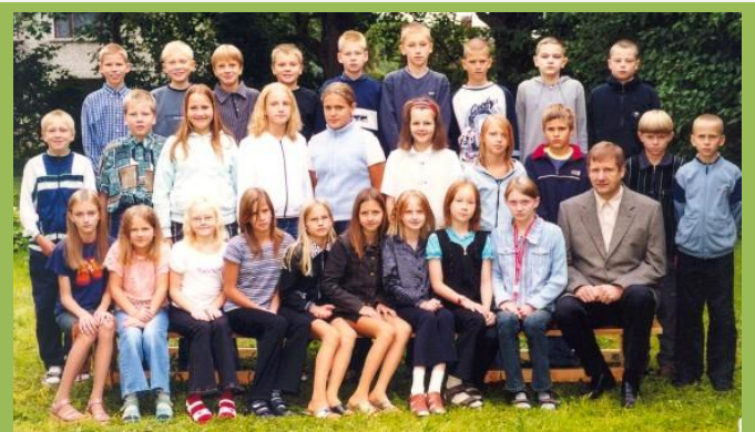
Klassipildid aastast 1999 ja 2003