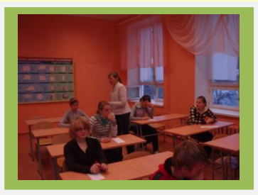
Kes ütles, et peastarvutamine on kerge!