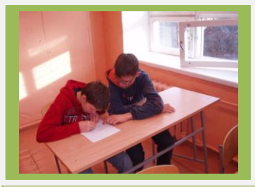
Koos on kergem