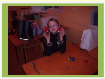
Kes see veel on?

17.-21. novembrini toimus meie koolis matemaatikanädal. Igaks päevaks olid planeeritud erinevad ülesanded.