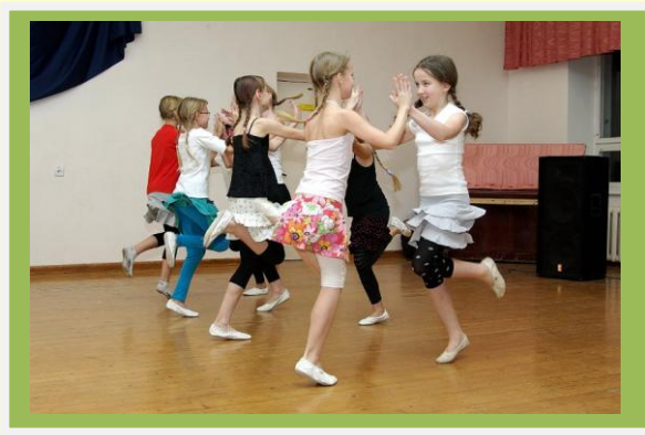
4.a klassi tantsutüdrukud